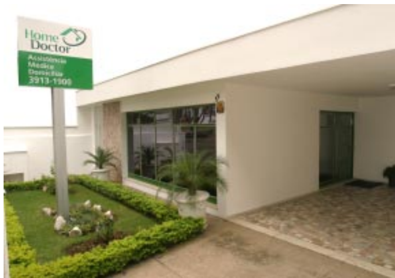
Unidade Vale do Paraíba.

"Tais resultados mostram que os investimentos efetuados ao longo dos últimos anos pela Home Doctor no sentido de ampliar o seu escopo de atuação foram estratégicos na