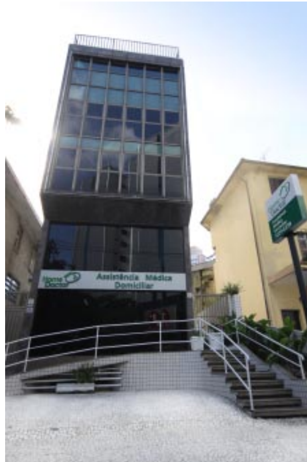
Unidade Baixada Santista.