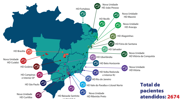
Figura 2. Abrangência de atendimento

CONCLUSÃO: Com a estruturação do Serviço de Controle de Infecção Domiciliar houve diversas melhorias voltadas para a segurança do paciente. Pudemos observar maior envolvimento das equipes nas discussões, bem como busca de ações e estratégias para promover a prevenção de infecção nos pacientes em Atenção Domiciliar.